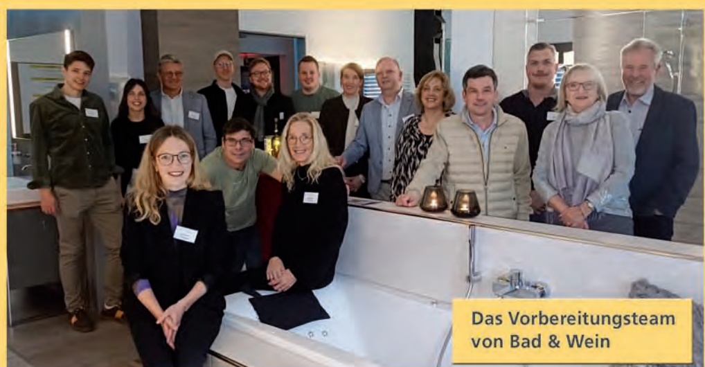
Das Vorbereitungsteam von Bad & Wein