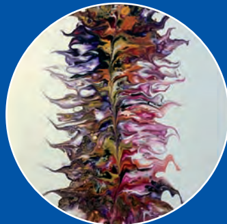
„Feathers“ – Ein Beispiel für Acrylic Pouring