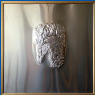
„Feuerpferdchen“ Prickelei auf Aluminium