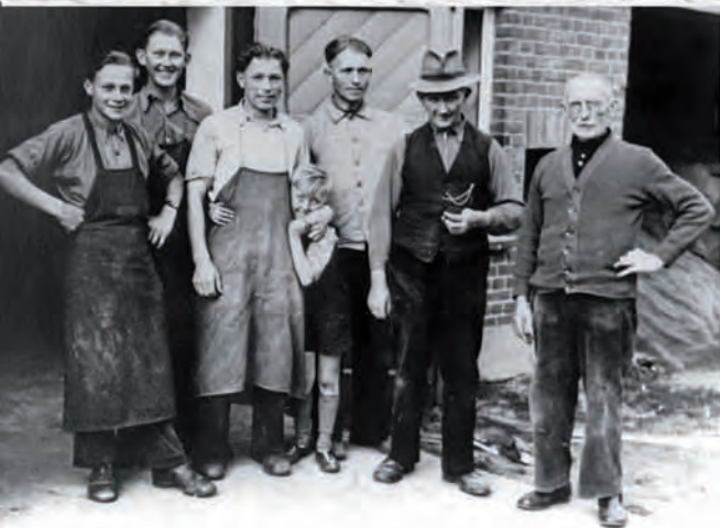
Holdschlag-Mitarbeiter vergangener Tage (nach dem 2. Weltkrieg) und das aktuelle Team der Holdschlag GmbH