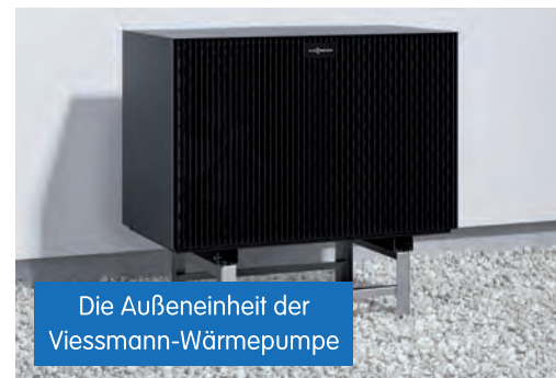
Die Außeneinheit der Viessmann-Wärmepumpe